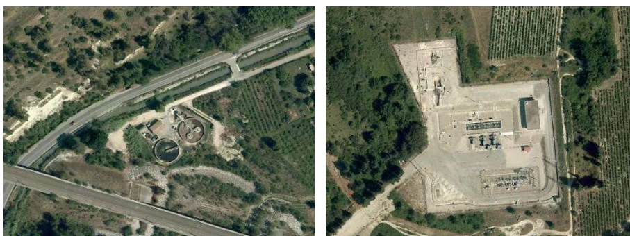
Station d'épuration - Poste électrique