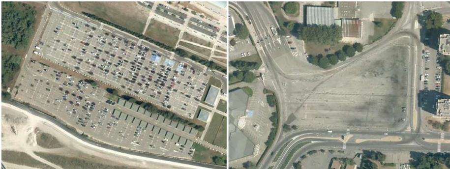
Grand parkings - stationnement