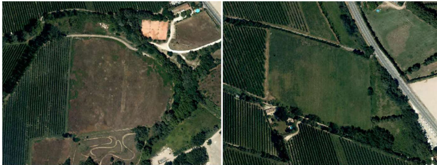
Terres en interculture