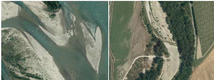
Plages, dunes et sables