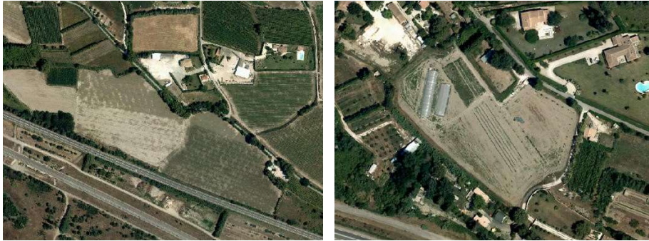
Culture légumières et maraichères de plein champ et horticulture