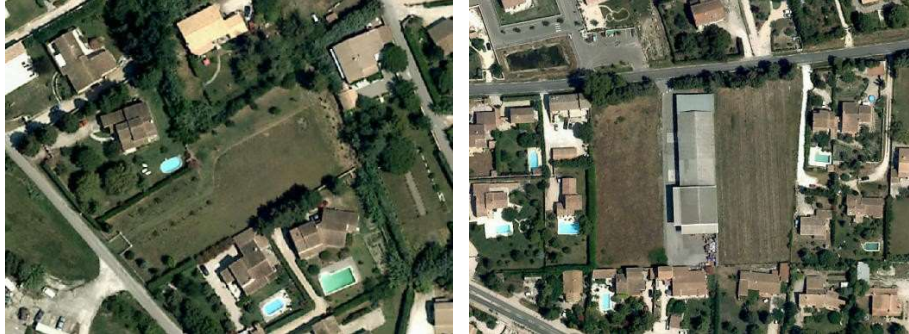
Terrain vague en milieu urbanisé