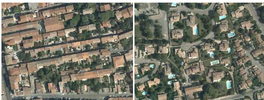
Bâti individuel dense