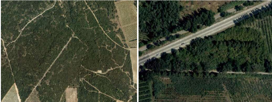
Formation arbustive fermée