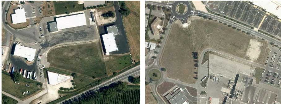
Terrain vague en zone d'activité