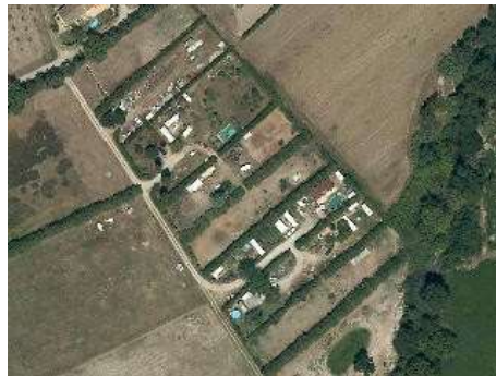
Habitations légères en milieu agricole