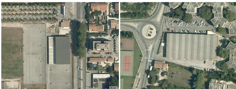
Espaces bâtis de sports et de loisirs