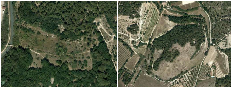
Pelouses et pâturages naturels