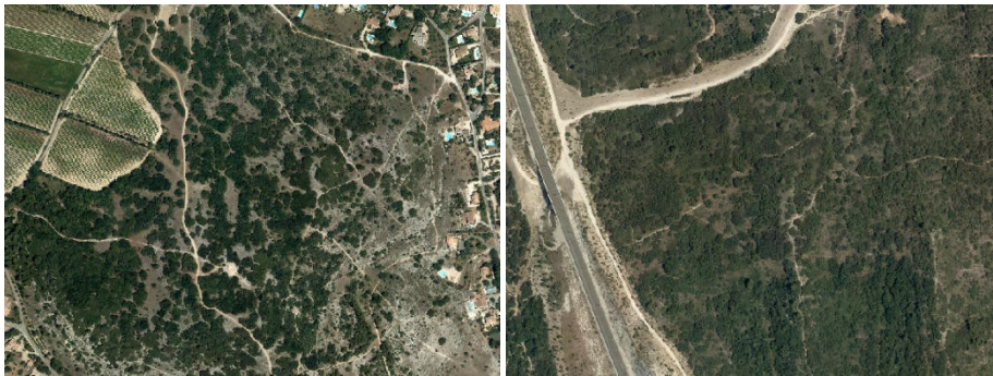
Formations semi-ouvertes arbustives et/ou arborées