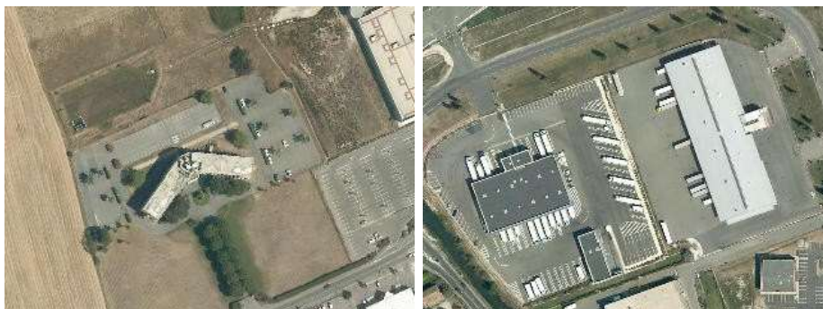
Espaces d'activités économiques