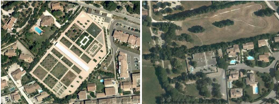
Parcs verts urbains