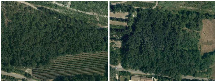
Forêts de feuillus