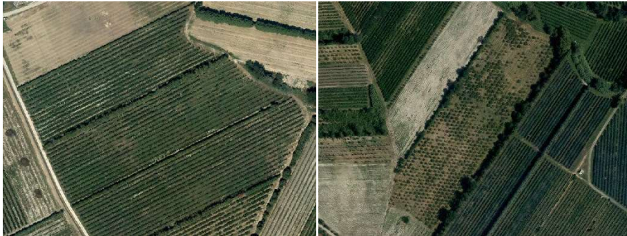
Vergers et petits fruits