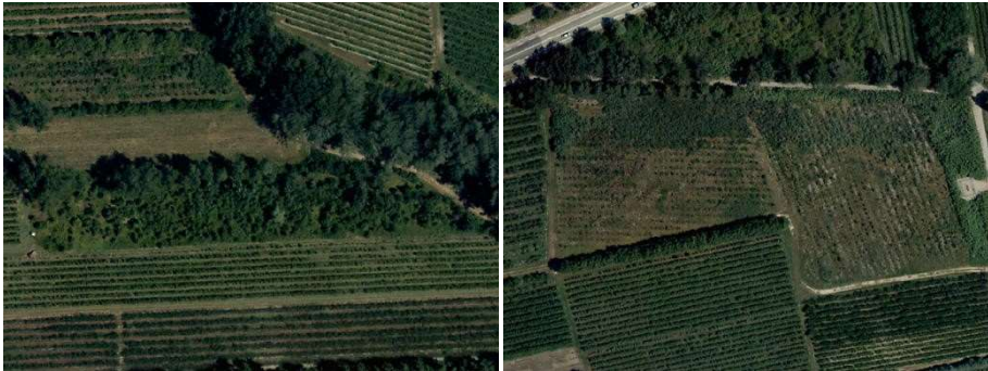
Friches agricoles et délaissés en milieu agricole