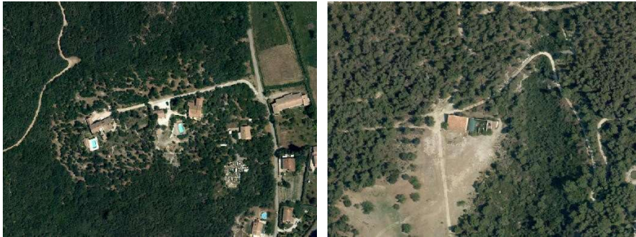
Bâti diffus en espace naturel