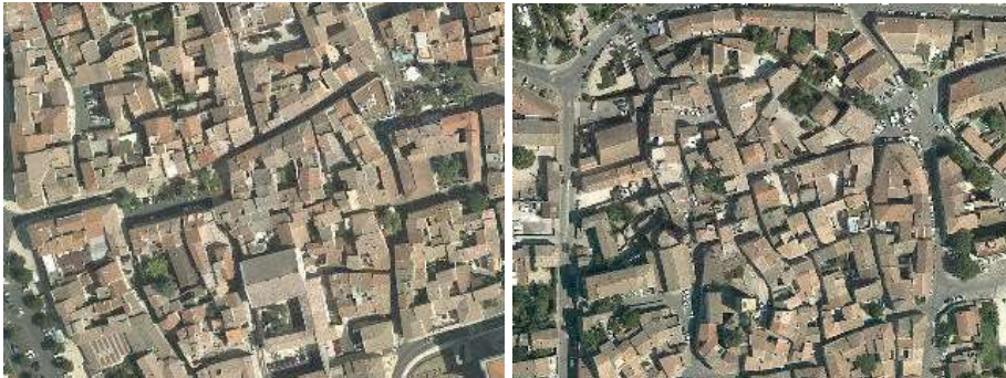
Tissu urbain compact