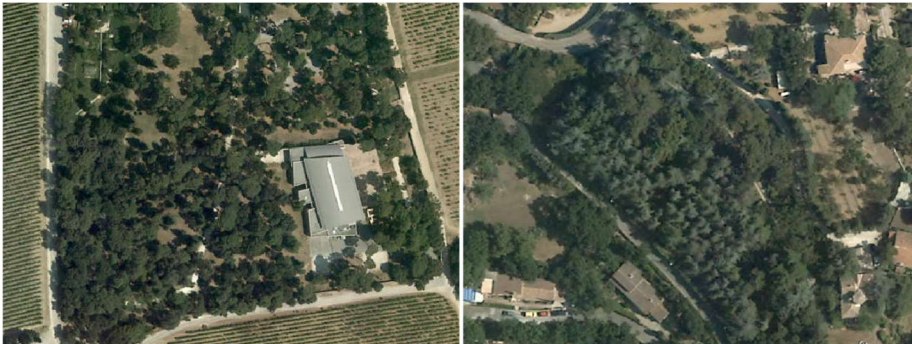
Forêts de conifères