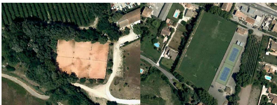
Espaces ouverts de sports et de loisirs