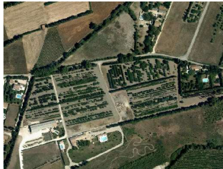
Pépinières (arbres, arbustes)