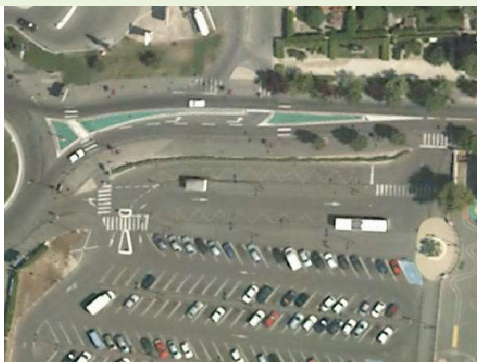
Réseaux routiers et espaces associés