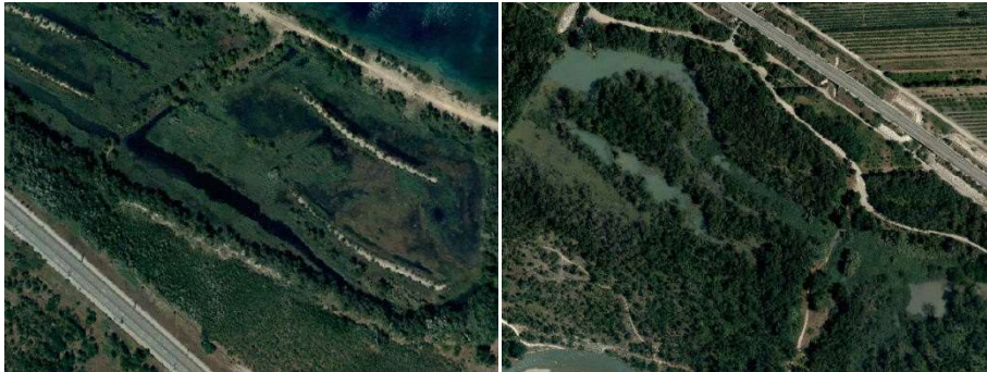
Zones humides indifférenciées