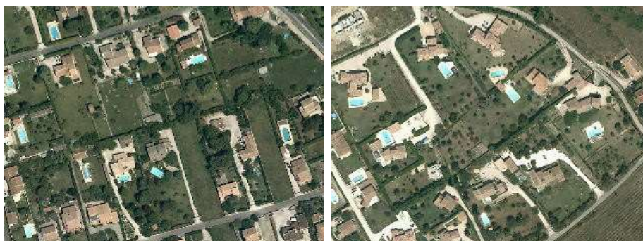
Bâti individuel lâche