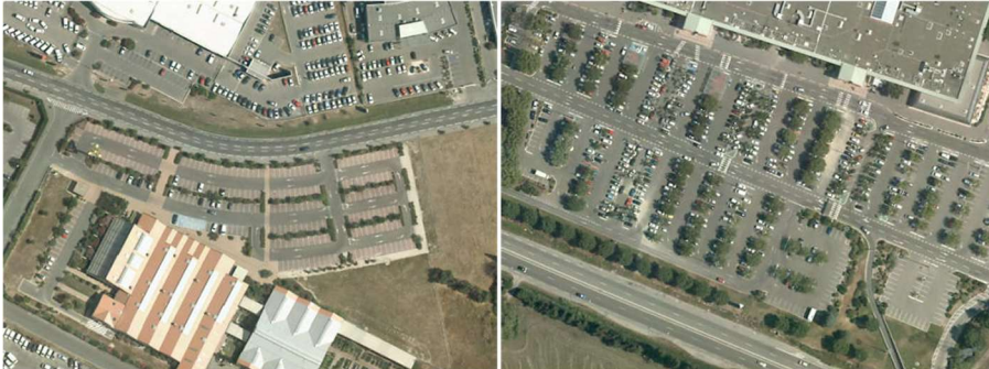
Grands parkings commerciaux