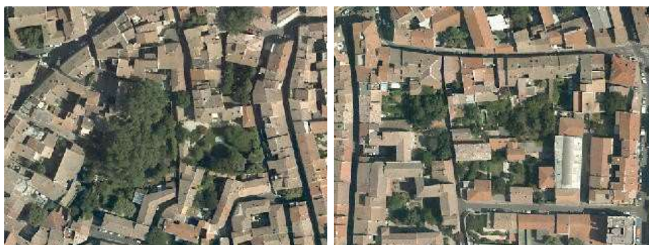
Tissu urbain aéré