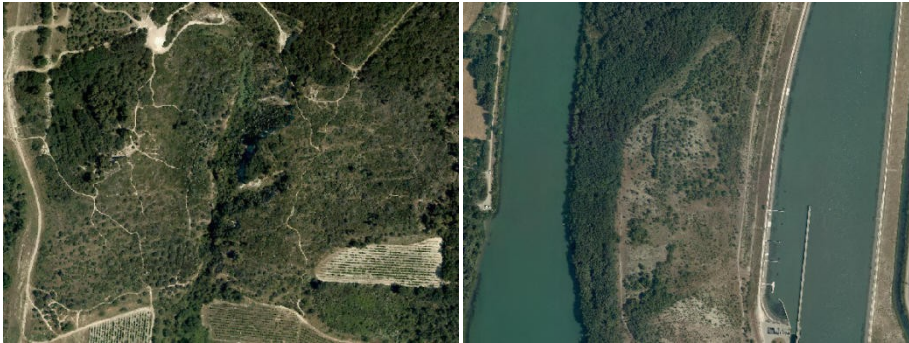
Formations ouvertes arbustives et/ou arborées