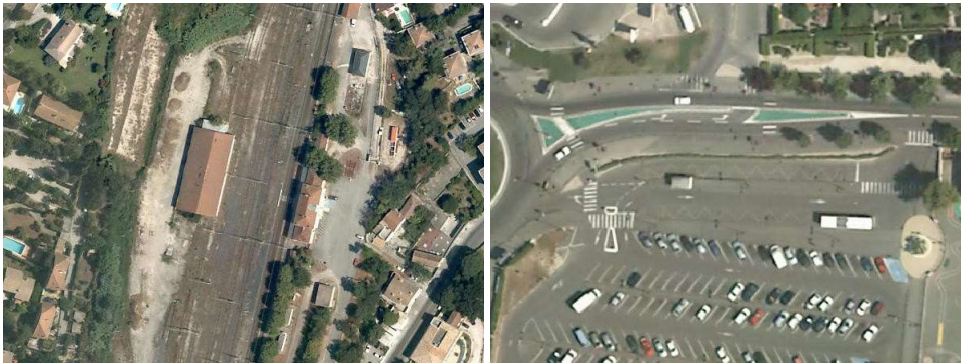
Gare ferroviaire - Gare routière