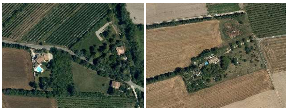
Bâti diffus en espace agricole