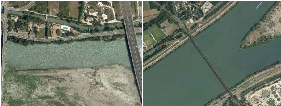
Cours et voies d'eau