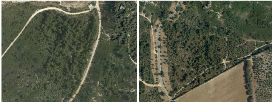
Formation principalement arborée