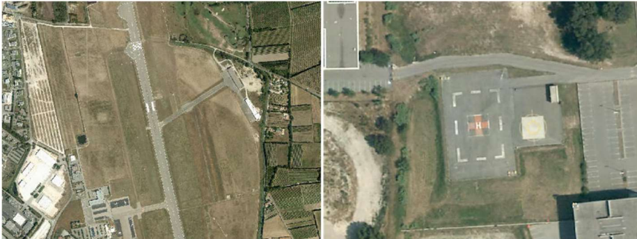
Aéroport - Hélicopt