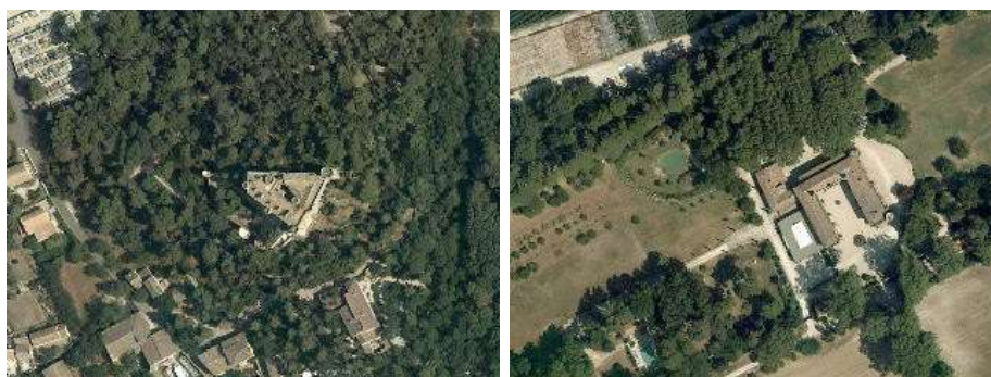
Bâti individuel dans parc paysager